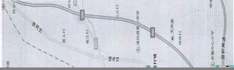
附件 1：培训地址详细路线